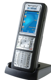
TÉLÉPHONE SIP-DECT MITEL 632

Rendez-vous sur mitel.fr/micloud-office ou contactez votre revendeur pour en savoir plus sur la manière dont MiCloud Office peut vous aider à faire la différence.