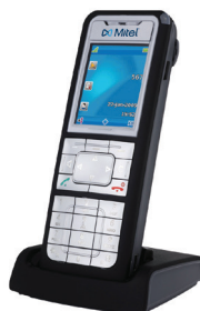
TÉLÉPHONE SIP-DECT MITEL 622