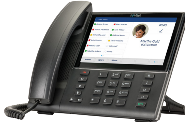
TÉLÉPHONE SIP MITEL 6873