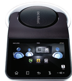
TÉLÉPHONE DE CONFÉRENCE MITEL MIVOICE (AUDIO/VIDÉO)