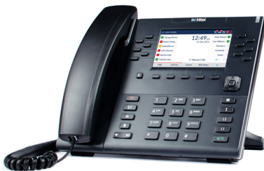
TÉLÉPHONE SIP MITEL 6869