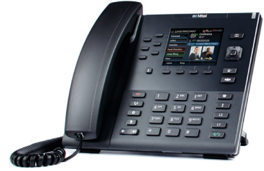
TÉLÉPHONE SIP MITEL 6867