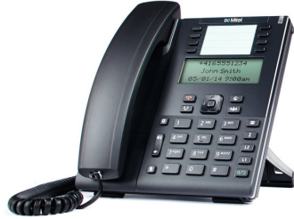
TÉLÉPHONE SIP MITEL 6865