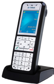
TÉLÉPHONE SIP-DECT MITEL 612