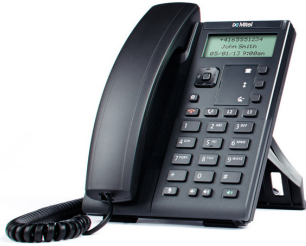
TÉLÉPHONE SIP MITEL 6863

Des options d'achat et de location sont disponibles.